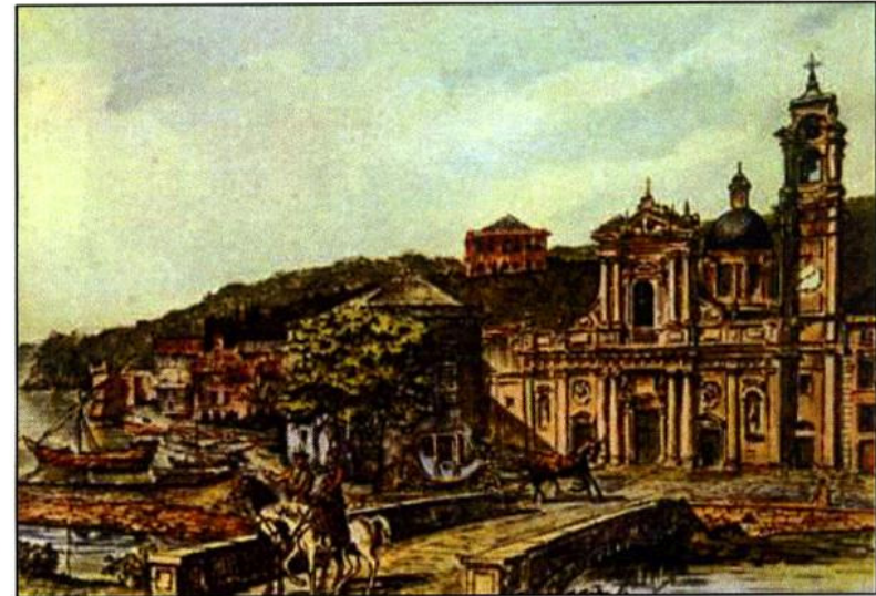
Piazza Caprera in una stampa antica

Nelle pagine che seguono, cercheremo di capire come mai un borgo di pescatori, che quasi certamente Napoleone non visitò mai, fu oggetto di tanta attenzione.